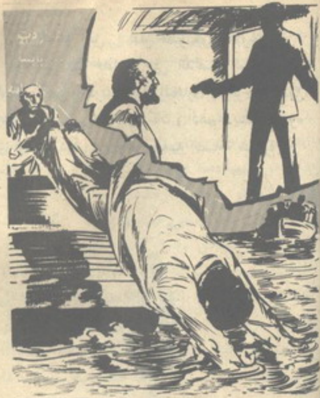
وبقفزة بارعة عبر سور اليخت ، وغطس في الماء ..

— هيا .. فليعاون كل منكم الآخر في إطفاء النيران ، ثم سنعود إلى ميناء ( دوغر ) .